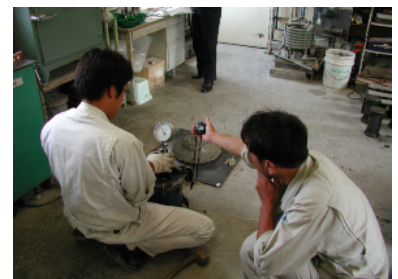
軽量コンクリートの空気量測定