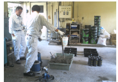
認証製品試験員による測定作業