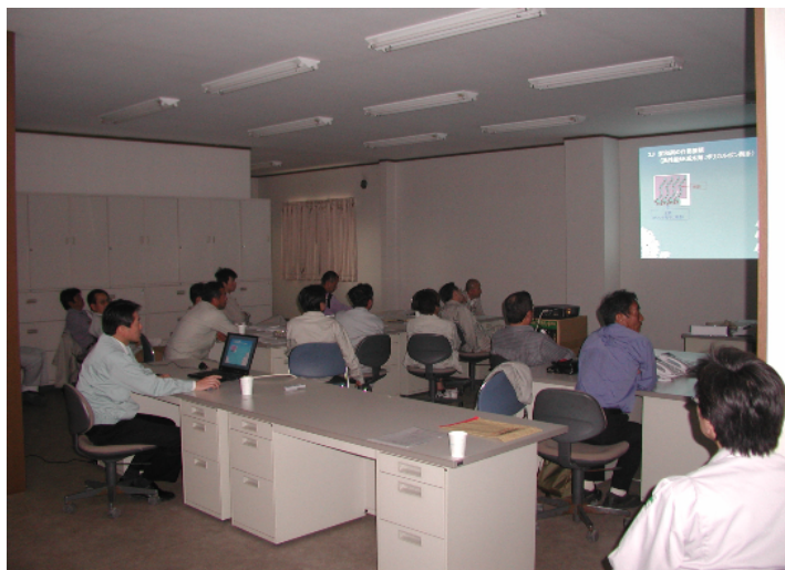
コンクリートの材料についての講演